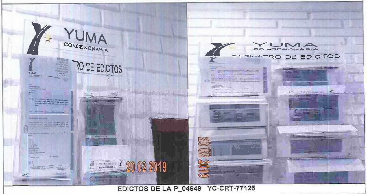
EDICTOS DE LA P_04649 YC-CRT-77125